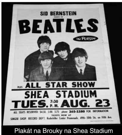
Plakát na Brouky na Shea Stadium

V americkém aukčním domě Phillip Weis byl 25. dubna 2010 za 5 tisíc dolarů vydražen plakát Beatles z roku 1966, který zval na druhý koncert Brouků na Shea Stadium v New Yorku dne 23. srpna. Jeho původ byl notářsky ověřen a jeho pravost potvrdili Sid Bernstein, jehož jméno je vytištěno nad Fab Four.