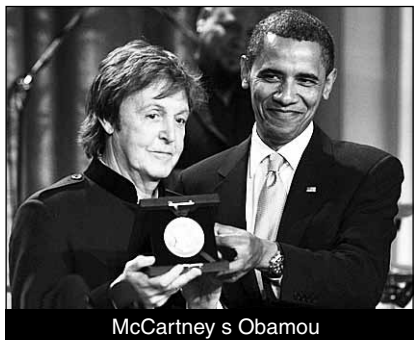
McCartney s Obamou

2. června převzal Paul McCartney z rukou amerického prezidenta Baracka Obamy Gershwinovu cenu, kterou uděluje Kongresová knihovna USA za celoživotní dílo. Ceremoniál proběhl ve východních pokojích Bílého domu ve Washingtonu. Stejně ocenění před exbeatlem získali pouze Stevie Wonder a Paul Simon.