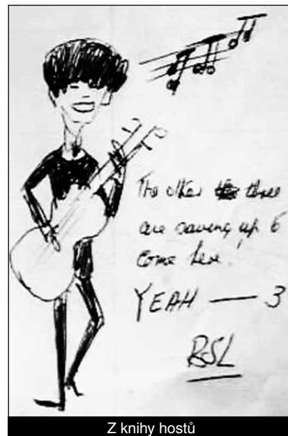
Z knihy hostů

27. dubna se uskutečnila aukce, jejímž hlavním tahákem byl autoportrét Johna Lennona z knihy hostů restaurace Jammets v Dublinu. Kresba není datována, ale nejspíš vznikla v listopadu 1963, kdy Beatles v Dublinu koncertovali. Předpokládaná cena 2,5 tisíce EUR byla konečnými 11.933 € mnohonásobně překonána.