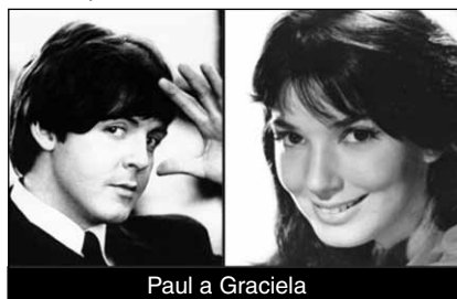
Paul a Graciela

Argentinská herečka Graciela Borges přiznala, že měla intimní románek s Paulem McCartneyem. Zpráva způsobila poprask mezi argentinskými fanoušky Beatles. Vše prasklo během rozhovoru, kde byla Graciela překvapena otázkou na toto téma a odpověděla: „To už je dávno... Jeden čas jsem byla jeho blízkou přítelkyní. Bylo to v Londýně. Paul byl hezký a já se s ním cítila skvěle. Měli jsme nádherný vztah, který trval necelý rok.“ Dál už však herečka do větších podrobností nešla.