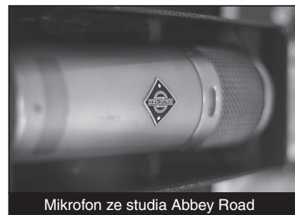
Mikrofon ze studia Abbey Road

Nová výstava týkající se Beatles je k vidění v kalifornském Calsbadu. Místní muzeum hudební tvorby vystavuje předměty z nahrávacího studia Abbey Road. Návštěvníci tak mohou slyšet písně Beatles na původních studiových reproduktorech, na kterých je poslouchali při nahrávání členové skupiny. Vystaven je také osmistopý magnetofon, na kterém bylo nahráno dvojalbum The Beatles. Zvukový inženýr John Kurlander zapůjčil sérii tabulek z roku 1966, které ukazují, na jakém vybavení v té době Beatles nahrávali. Dále tu najdete mikrofony, zesilovače a další věci nezbytné pro chod nahrávacího studia. Výstava trvá do července letošního roku.