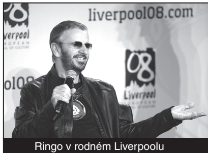
Ringo v rodném Liverpoolu

Sedmašedesátiletý autor nejznámějšího sólového hitu Photograph, Ringo Starr přiznal, že už mu leze na nervy, když se o něm stále píše jako o slavném bubeníkovi Beatles. Přál by si, aby lidé kladli menší důraz na tu část jeho kariéry, kterou strávil v legendární liverpolské kapele, a ocenili jeho celou kariéru bubeníka, zpěváka i skladatele. „Někdy už mám těch Beatles plné zuby. Myslím si, že až umřu, bude na mém náhrobku vytesán nápis – Bývalý člen Beatles. Jako bych nikdy ničeho víc nedosáhl,“ stěžuje si Ringo. Ale co nadělá, když ty jeho sólové úspěchy jsou jako zrnko máku v porovnání s miliardou prodaných nosičů nejpopulárnější kapely na světě.