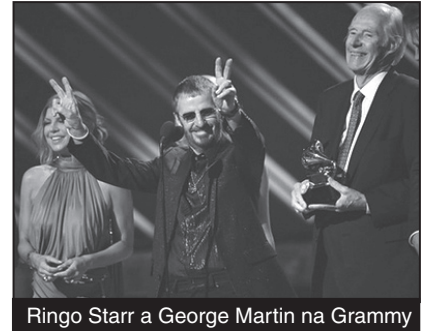
Ringo Starr a George Martin na Grammy