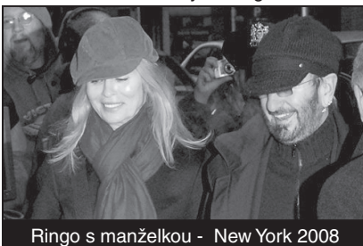
Ringo s manželkou - New York 2008

Populární důchodce Ringo Starr (67) stále mladě vypadá díky pravidelnému cvičení a krásné manželce. Barbora Bachová si prý zaslouží, aby se kvůli ní vzpíral procesu stárnutí. „Pracuji na sobě, mám trenéra, hlídám si co jím a jsem zamilovaný do krásné dívky. A to mě drží mladým,“ uvedl Ringo na lednové talk show Larryho Kinga.