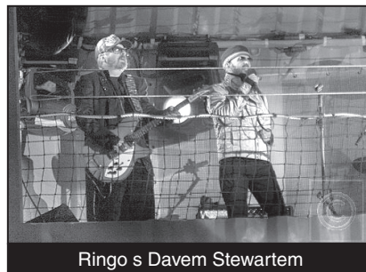
Ringo s Davem Stewartem

Koncertem za účasti kolem 600 hudebníků, akrobatů a dětských zpěváků začala 11. ledna v Liverpoolu série akcí, na kterých město uctí rozhodnutí Evropské unie, že je evropskou kulturní metropolí roku 2008. Hlavní hvězdou zahajovacího večera se stal místní rodák a bývalý bubeník Beatles Ringo Starr, který na koncertu pod širým nebem představil zbrusu nové album Liverpool 08. Tucet skladeb, které složil společně s Davem Stewartem ze skupiny Eurythmics, označil za poctu rodné čtvrti a za svou malou hudební biografii.