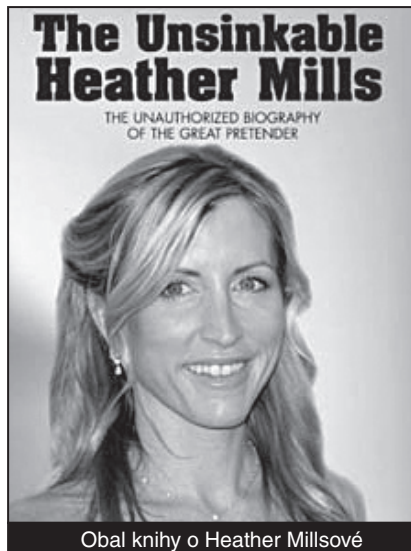
Obal knihy o Heather Millsové