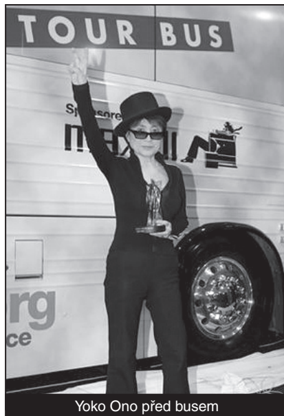
Yoko Ono před busem

Yoko Ono představila 8. ledna hudební vzdělávací autobus, který je věnován památce Johna Lennona. Autobus, který byl poprvé představen v Las Vegas, má v sobě uschováno nahrávací studio. V průběhu letošního roku projede Spojené státy a Kanadu a poučí děti o tom, jak vznikají nahrávky písniček. Mezi sponzory tohoto turné patří i Apple nebo Maxell.