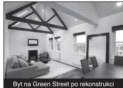
Byt na Green Street po rekonstrukci