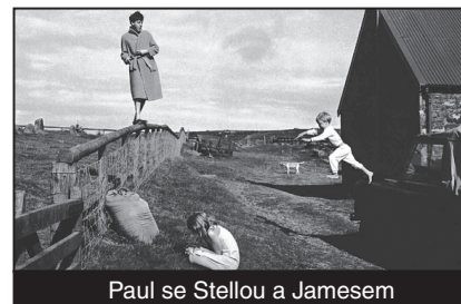
Paul se Stellou a Jamesem