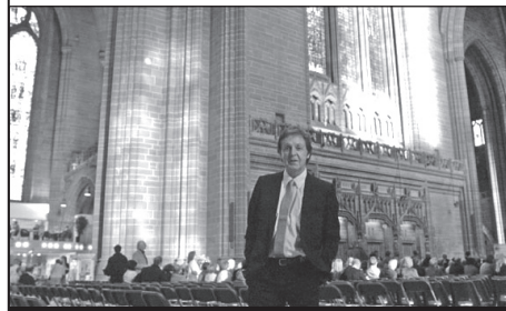
Paul v liverpolské katedrále

Na prvního máje aplaudovala vyprodaná liverpolská katedrála (1.500 posluchačů) místnímu rodákovi Paulu McCartneymu po provedení jeho Ecce Cor Meum. Koncert liverpolského symfonického orchestru se sborem se uskutečnil v rámci letošních městských oslav. Sir Paul vyrazil do katedrály již den před tím, aby si poslechl místní sbor při zkoušce.