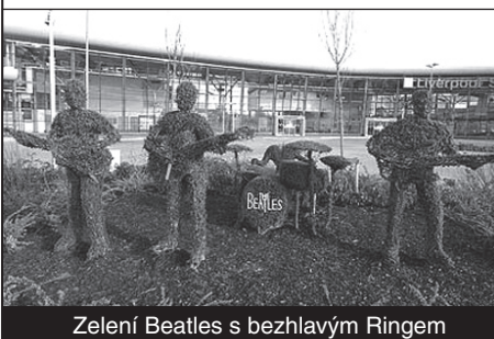
Zelení Beatles s bezhlavým Ringem

Ještě tři měsíce po nelichotivých poznámkách na adresu rodného města (viz Novinky 1/2008) má Ringo Starr v Liverpoolu spoustu rozložených nepřátel. Ti si tentokrát svůj vztek vylili na sousoší Beatles před nádražím Liverpool South Parkway. Každý člen skupiny je zde v životní velikosti ostříháním vytvářován na živých keřích. Starr i s bicími. A právě Ringo teď přišel po nájezdu vandálů o hlavu.