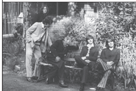
Jak jsem spal s Beatles

Tom Murray, který jednoho červencového dne v roce 1968 fotografoval Beatles v Londýně, pořídil také snímek, na němž Brouci pózuji na lavičce s neznámým tvrdě spícím mužem. „Celou dobu spal,“ říká Murray. „Vždycky mě zajímalo, jestli mu někdo tu fotku ukázal a zeptal se ho: Ty se znáš s Beatles? Tady sedí vedle tebe. . . Co on asi na to.“