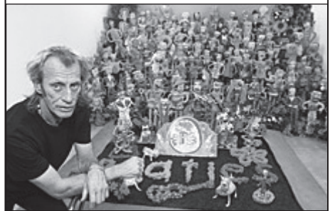
Keramická verze Sgt. Pepra