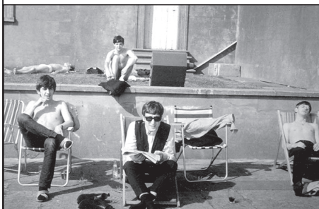
Chvilky volna ve Wenston-Super-Mare

užívajících si klidu a relaxování ve známém anglickém letovisku. Idylka působí jako klid před bouří. Již za měsíc totiž vychází singl She Loves You, vzniká pojem Beatlemánie a z Brouků se stávají celosvětové hvězdy. Autorská práva k těmto fotografiím získal od neznámého autora publicista Tony Barrow, který se skupinou spolupracoval v letech 1963 – 1968, a nyní se chystá je publikovat v nové knize o Beatles.