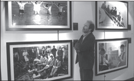
Američtí Beatles doma

Fotografická výstava zachycující Beatles během jejich první návštěvy USA má britský debut v Liverpoolu. Beatles Story v Albertových docích získalo práva na expozici více než 80 fotografií, která byla před tím instalována ve washingtonském Smithsonian Institute, kde ji shlédly 3 milióny návštěvníků. Fotografie pocházejí z archivu televize CBS a fotografa časopisu LIFE Billa Eppridge. Výstava končí 15. srpna 2008.