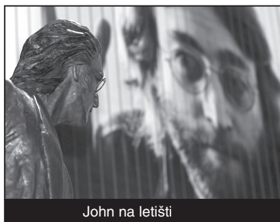
John na letišti

Jedna z nejznámějších soch stojících v Liverpoolu byla okradena. Bronzové soše Johna Lennona stojící na liverpoolském letišti chybí brýle. Zatím neznámý pachatel či sběratel suvenýrů je totiž odcizil. Mluvčí letiště ve Speke však potvrdil, že budou doplněny tak rychle, jak jen to bude možné.