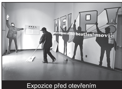
Expozice před otevřením

V Muzeu Rock and Rollové Dvorany slávy v Clevelandu byl otevřen nový výstavní exponát věnovaný druhému celovečernímu filmu Beatles – Help! Nechybí fotografie, pracovní scénář, informační materiály pro tisk a vstupenky na americkou premiéru. Největším lákadlem jsou však kostýmy, ve kterých skupina točila a nástroje, na které ve filmu hrála. Výstavu mohou návštěvníci shlédnout od 17. listopadu do 30. března 2008.