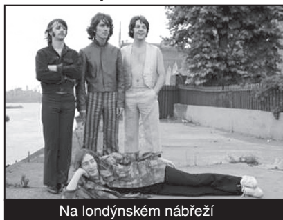
Na londýnském nábřeží