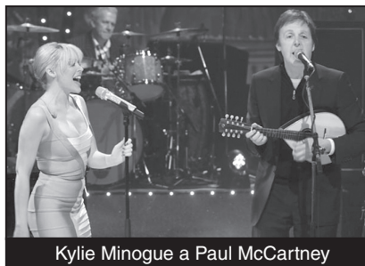
Kylie Minogue a Paul McCartney

Paul McCartney prodělal o vánočních svátcích operaci srdce. Že se necítí dobře si začal stěžovat na podzim v souvislosti s rozvodem s Heather Millsovou. Po zdravotní kontrole na konci roku lékaři rozhodli, že je potřeba operace. McCartney prodělal takzvanou angioplastiku. Jde o rutinní zákrok, ale každý zásah do srdce je vážná věc, citoval britský tisk lékaře. Paul se po operaci rychle zotavil. O tom svědčí i novoroční televizní vystoupení, ve kterém zazpíval společně s Kylie Minogue svou píseň Dance Tonight .