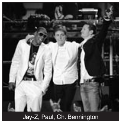
Jay-Z, Paul, Ch. Bennington

Poprvé ve své kariéře vystoupil Paul McCartney při slavnostním udělování prestižních cen Grammy, které se uskutečnilo 8. února v Los Angeles. Muzikant, který během čtyřicetileté kariéry získal třináct malých gramofónků, byl i v tomto roce nominován v kategoriích: nejlepší album, nejlepší popový interpret a nejlepší popové album. Žádnou cenu však nezískal. Zato si společně s rapperem Jay-Z a Chesterem Benningtonem ze skupiny Linkin Park zazpíval Yesterday , a sólově předvedl beatlesáckou Helter Skelter .