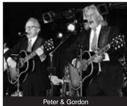
Peter & Gordon