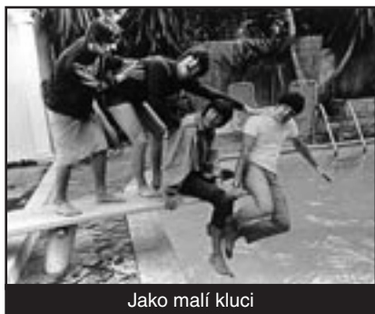
Jako malí kluci

Více jak 500 doposud nepublikovaných fotografií skupiny Beatles, pořízených při natáčení filmu Help!, objevili ve skladě skotské University of Dundee. Autorem byl fotograf Michael Peto, který je před svou smrtí v roce 1970 odkázal právě tomuto ústavu. Fotografie nedávno objevil pracovník univerzity, který začal ukládat školní fotografie do digitální podoby. Pětatřicet let staré momenty nyní vyšly v knize s názvem Now These Days Are Gone.