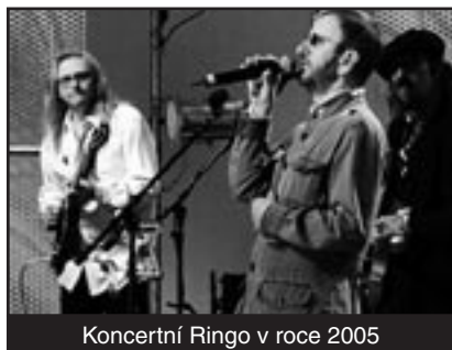
Koncertní Ringo v roce 2005

Ringo Starr oznámil na svých oficiálních webových stránkách www.ringostarr.com , že se letos v létě chystá vyrazit na turné s nejnovější sestavou pod názvem 9th All Starr Band. Jejím členy by měli být: Rod Argent, Mark Hudson, Richard Marx, Billy Squier, Edgar Winter, Sheila E. a Mark Rivera. Startuje se 14. června v kanadském Casino Rama a končí 20. července v newyorské Radio City Music Hall.