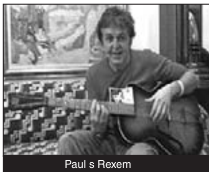
Paul s Rexem