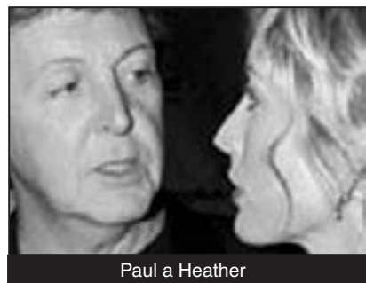
Paul a Heather