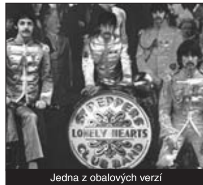
Jedna z obalových verzí

Album skupiny Beatles Sgt. Pepper's Lonely Hearts Club Band bylo vyhlášeno nejlepší deskou všech dob. Žebříček byl sestaven k 50. výročí vzniku britské hitparády. Na druhém místě, se ztrátou 201 hlasů, se umístil Michael Jackson s albem Thriller. Beatles měli v první desítce ještě alba Revolver (6.), Abbey Road (8.) a The Beatles (10.) Celkem hlasovalo 220 tisíc lidí.