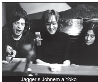
Jagger s Johnem a Yoko

Sir Mick Jagger z Rolling Stones je přesvědčen, že Yoko Ono bránila Johnu Lennonovi v kontaktech s kamarády rockery. Byla přesvědčena, že na něho mají „špatný vliv“. Jagger to dokazuje na rozpadu svého přátelství s Lennoem. V roce 1973, kdy se John s Yoko dočasně rozešli, chodili spolu často na různé večírky. Když se ale John o rok později k Ono vrátil, kamarádství s Mickem okamžitě skončilo. Jagger se pak už s Lennoem nikdy nesetkal.