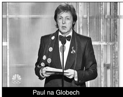
Paul na Globech

Paul McCartney předával na nedělních Zlatých globech cenu za nejlepší animovaný film. Vítězný snímek Vzhůru do oblak uvedl žertovně: „Ahoj, jsem Paul McCartney, nyní spíš známý jako hoch z Rock Bandu“. Zavzpomínal si také na projekt Žluté ponorky a svůj příspěvek uzavřel slovy: „Animace není jenom pro děti, ale i pro dospělé, kteří berou drogy.“ Ceny za nejlepší filmovou píseň se však nedočkal.