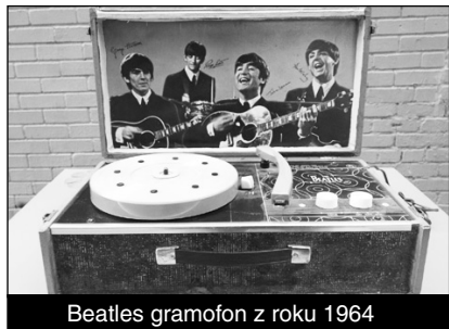
Beatles gramofon z roku 1964

Čtyřrychlostní NEMS Beatles kufříkový gramofon (Model: 1000), vyrobený v roce 1964, byl na eBay vydražen za 12.100 dolarů. Podle odhadu bylo vyrobeno jen asi pět tisíc kusů tohoto zvukového nosiče. Nabízený gramofon se mohl pochlubit bezvadným stavem, po léta byl odložen někde na půdě či v garáži.