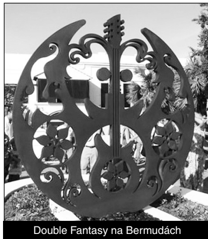
Double Fantasy na Bermudách

V červnu 2012 byla v bermudské Botanical Gardens odhalena plastika Double Fantasy jako vzpomínka na zdejší Lennonův pobyt v roce 1980. Šestimetrové ocelové sousoší zobrazuje dvojitou Johnovu tvář spolu s kytarou, květinami a holubicemi.