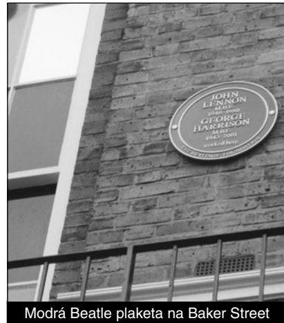
Modrá Beatle plaketa na Baker Street