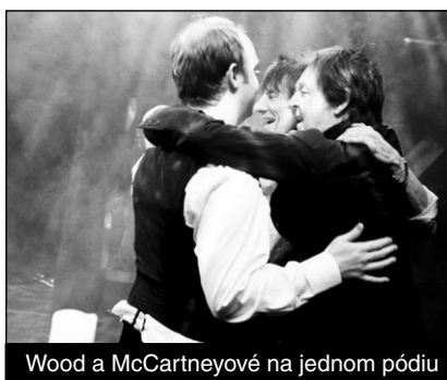
Wood a McCartneyové na jednom pódiu

Na koncertě Jamese McCartneyho v londýnském divadle Ambassador čekalo diváky příjemné překvapení. Na pódiu se k němu přidal Ronnie Wood z Rolling Stones na kytaru a Jamesův otec Paul McCartney na piano.