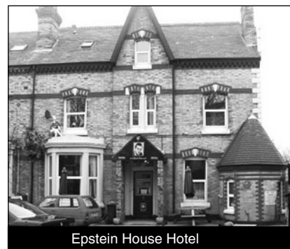
Epstein House Hotel