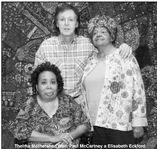
Thelma Mothershed Wair, Paul McCartney a Elisabeth Eckford

Paul McCartney se během koncertního zastavení v Little Rocku setkal se dvěma ženami, které ho inspirovali k napsání písně Blackbird. V roce 1954 byly mezi devíti černými studenty, kteří se pokusili nastoupit na „bělošskou“ střední školu ve městě Little Rock (Arkansas). Guvernér státu Arkansas povolal národní gardu, aby jim zabránila ve vstupu do budovy. Prezident Eisenhower na incident reagoval vysláním tisíce výsadkářů, kteří měli ochránit devět černých studentů a kteří zůstali v Little Rocku po celý školní rok. Brzy po těchto událostech byla rasová segregace na jihu oficiálně zrušena. McCartney k tomu dodal: „Chtěli jsme vědět, o co šlo, a měli jsme pochopení pro lidi procházející těmito útrapami. A to mě nutilo napsat tuto píseň.“