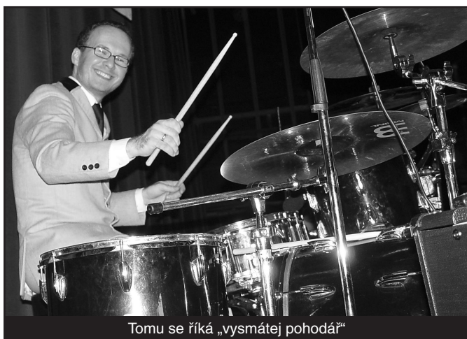
Tomu se říká „vysmátej pohodář“

Skupina má své slabůstky, které však zaniknou v době a profesionálně odehraném repertoáru. Nejslabší místo vidím v postavě bubeníka, který přece jenom by mohl být o kousíček lepší, aby byl soubor instrumentálně vyrovnaný.