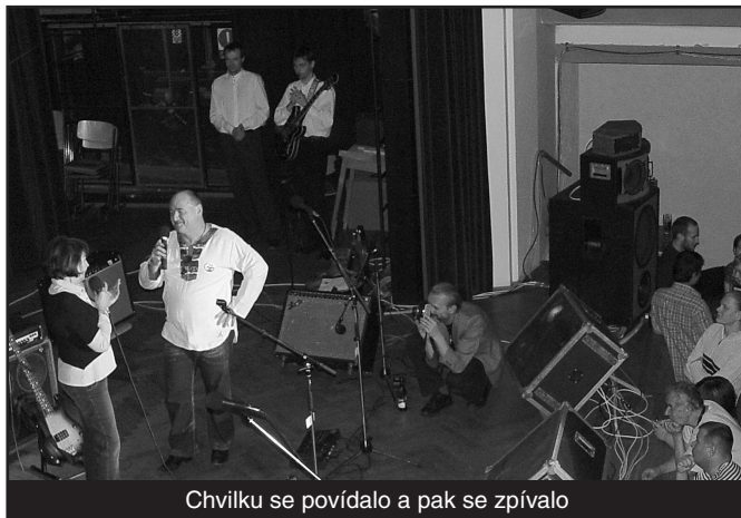
Chvilku se povídalo a pak se zpívalo

Rozhovor s paní Martou na pódiu byl velmi příjemný a zajímavý. Nevyhýbala se žádným tématům, upřímně a věcně reagovala na všechny položené otázky. Pak přišlo to nejdůležitější - zpívání. Málokterá česká coververze beatlesácké písničky zní mému uchu tak dobře, jako právě její prezentace Hey Jude. Dokonce ani český text mi zde vůbec nevadil. Dovolují si tvrdit, že letošní host našeho setkání byl srovnatelný zatím s tím nejváženějším hostem našich akcí, Karlem Gottem. Jen pro zajímavost uvedu, že při předběžném jednání s paní Kubišovou ohledně zazpívání zvolené písně Hey Jude na můj dotaz, zda bude zpívat na half playback, který si donese, či bude-li vůbec chtít zpívat živě, odpověděla otázkou: „A ti muzikanti, co tam budou Hey Jude neumějí?“ Reagoval jsem obratem: „Jasně, že umějí, dokonce všichni!“ „Tak o čem je řeč?“ odpověděla paní Kubišová. Zpívám to v G-dur.