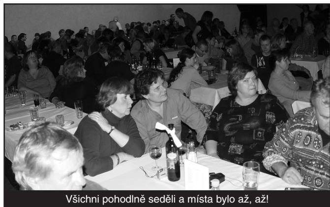
Všichni pohodlně seděli a místa bylo až, až!

A dobře jsem učinil. Rozhodnutí nových mocipánů obvodu Jižního města totiž bylo nezvratné a jasné. KD Opatov se ruší. Že to bylo nerozumné a pro občany tohoto obvodu negativní řešení, bylo každému zainteresovanému člověku jasné, a pro aktivity našeho klubu potažmo velmi nepříjemné. Tedy stáli jsme před rozhodnutím, do jakých prostor svou největší akci přesunout, a kde letos setkání uspořádat. A nové problémy jsou tu znovu a není jich málo.