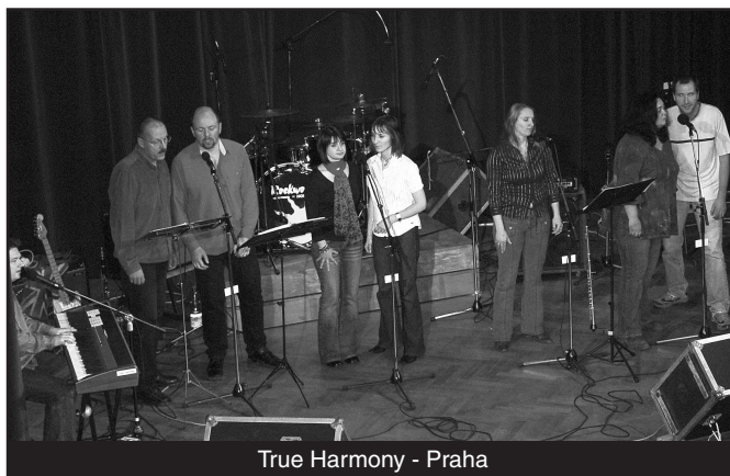
True Harmony - Praha

Druhá kapela, True Harmony, pro kterou se spíše však hodí výraz vokální skupina, měla být jakýmsi kořením programu a ukázat tvorbu Beatles v trochu odlišné interpretaci. Kapela měla nastoupit už do rozjetého programu a nabídnout uklidnění a odpočinek. Bohužel se tak vlivem vývoje atmosféry nestalo a naopak se ovzduší ještě trochu „ochladilo“. Opět to ale nebyla vina účinkujících.