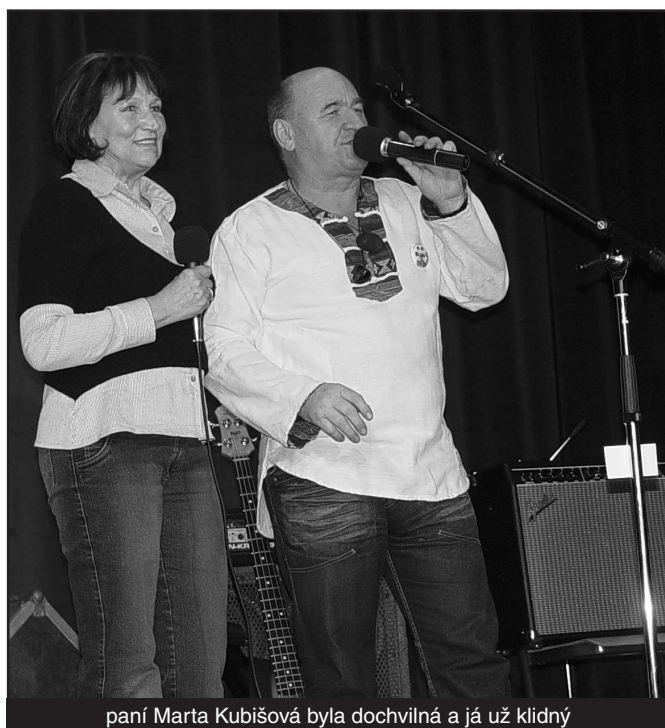
paní Marta Kubišová byla dochvilná a já už klidný

Paní Marta Kubišová dorazila do šatny účinkujících na minutu přesně a ve výborné náladě. Jako všechny „vipky“ našich setkání byla i ona překvapena výbornou atmosférou i hojnou účastí v sále. Překvapen jsem byl i já, a to paní Martou. Vstřícnost, upřímnost a úžasná schopnost komunikace, bez jakýchkoli hvězdných manýr, mě ujistila, že můj dosavadní, pozitivní, názor na tuto zpěvačku a ženu je správný, a je nutno ho ještě umocnit o velkou dávku osobní úcty i přátelství k této osudem tvrdě zkoušené ženě.