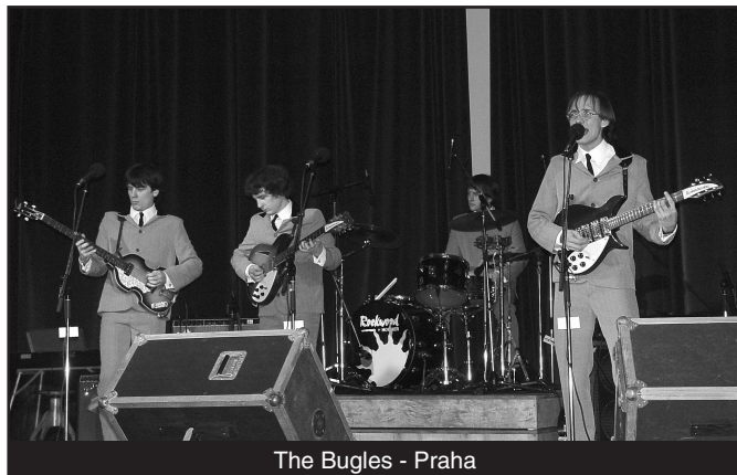
The Bugles - Praha

S dramaturgií letošního setkání jsem to měl opět o něco těžší, protože konkrétní jednání s účinkujícími mohlo začít až po vyřešení detailních podmínek nájmu sálu, a to bylo už v době, kdy většina kapel měla termín našeho setkání obsazený jiným vystoupením. Ale pojďme se v těchto řádcích i vzpomínkách vrátit k datu 7. prosince roku 2007. Začali jsme skoro přesně a poměrně zaplněný sál přivítal nám dobře známou pražskou skupinu Bugles, která už několikrát na našich setkáních vystoupila.