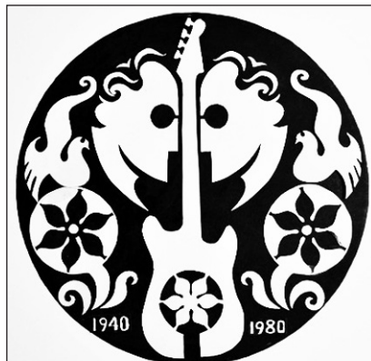
Johnova plastika pro botanickou zahradu

Na příští rok plánuje muzeum umění na Bermudách umístit plastiku Johna Lenno v místní botanické zahradě. Před 31 lety ho tu totiž inspiroval název překrásné frézie k pojmenování nového alba Double Fantasy. Návrh plastiky k uctění památky ex-beatla již odsouhlasila Yoko Ono i Julian Lennon.