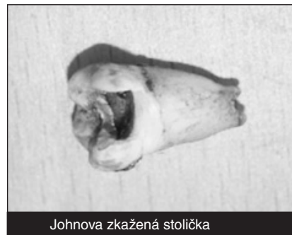
Johnova zkažená stolička

Vytržená stolička Johna Lenno byla vydražena za 32.500 dolarů. Neobvyklá memorabilie ze 60. let nakonec dosáhla dvojnásobek předpokládané ceny. Zoubek se dostal do povolanych rukou. Šťastným výhercem se totiž stal kanadský zubní lékař, který z odborného hlediska označil Johnův zub za značně neudržovaný.