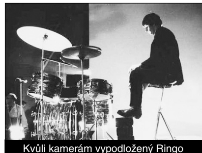
Kvůli kamerám vypodložený Ringo

Opět po téměř padesáti letech objevené dosud nepublikované snímky Beatles. Tentokrát se jedná o dvacet černobílých fotografií z natáčení filmu Perný den v londýnském divadle Scala (březen 1964). Autorem byl tehdy rekvizitář z Pinewood Studios, jistý Peter Alchrone, který ve volné chvíli fotil vše, co se ve studiu šustlo. Snímky pak založil do rodinného alba a až do nedávna se na ně zapomnělo. Nyní jdou do aukce.