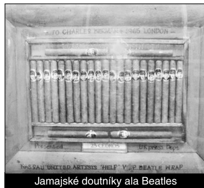
Jamajské doutníky ala Beatles