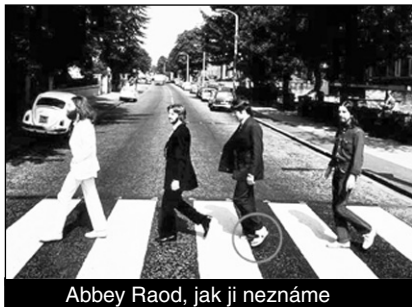
Abbey Road, jak ji neznáme

Opačně než na obalu desky Abbey Road jdou Beatles na snímku, který byl vydražen za 16 tisíc liber. Autor Iain Macmillan v roce 1969 během deseti minut pořídil na dnes již světznámém přechodu šest fotek. Tahle dražená je raritní nejen změnou směru chůze Brouků, ale Paul má na ní sandály a proti obalu mu chybí cigareta.