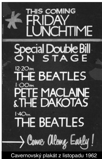
Cavernovský plakát z listopadu 1962

V Christie's aukční síni byl 12. června 2012 vydražen plakát, zvoucí na polední koncert Beatles 30. listopadu 1962 v Cavern Clubu. 70 x 50 cm ručně malovaného plakátu přišlo nového majitele na 27.500 liber. Vzácnost této dražené položky Christie's komentovala: „Jedná se o jedinou známou kopii tohoto plakátu. I další podobné ze začátku Beatles jsou velmi vzácné.“