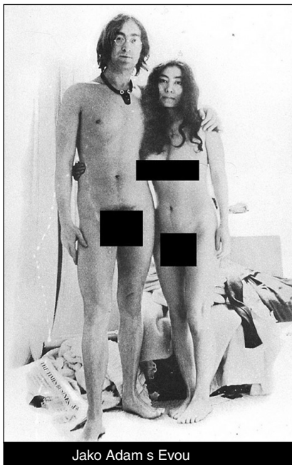
Jako Adam s Evou

Za 700 liber byly vydraženy dvě raritní fotografie nahého Johna Lennona s Yoko Ono. Oba snímky byly pořízeny samospouští v Ringově londýnském bytě na Montagu Square v roce 1968 pro obal alba Unfinished Music No. 1: Two Virgins. Album s tímto obalem odmítly vydat všechny velké společnosti včetně EMI. Prodejce objevil snímky v podkroví matčina domu a neměl vůbec ponětí, jak matka k těmto fotografiím přišla.