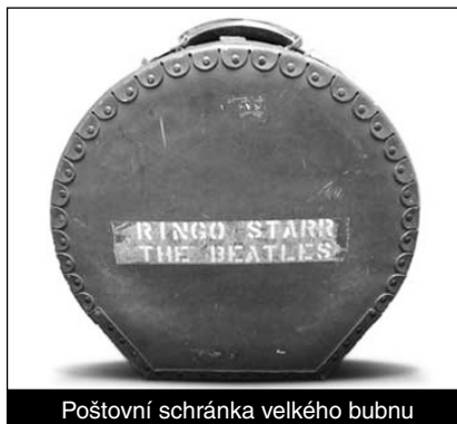
Poštovní schránka velkého bubnu

Velkou sběratelskou senzaci způsobilo objevení transportního obalu na velký buben ze soupravy Ringa Starra „Ludwig Hollywood“, kterou používal bubeník Brouků při natáčení Bílého dvojalba v roce 1968 a Let It Be o rok později. Jedna z poštovních průvodek, která se zachovala, má datum 8. 5. 1971. Buben směřoval do New Yorku na koncert pro Bangladesh. Vzácností je i další průvodka s podpisem Ringa. Obal má na obou stranách nápis „RINGO STARR THE BEATLES“.