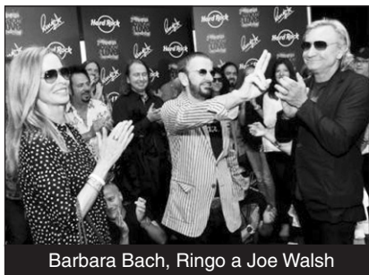
Barbara Bach, Ringo a Joe Walsh

Od roku 2008 se nic nezměnilo na stylu oslav narozenin Ringa Starra. I ty letošní 72. začaly tradičně ve 12 hodin před Hard Rock Cafe, po New Yorku, Chicagu a Hamburku, letos v Nashville. Vše se neslo v duchu hesla Peace and Love se zdviženými prsty ve tvaru V. Zástupy fanoušků se k oslavenci přidaly a dav mu zazpíval Happy Birthday a Give Peace A Chance. Vzduchem opět létali gumové náramky „Míru a lásky“.