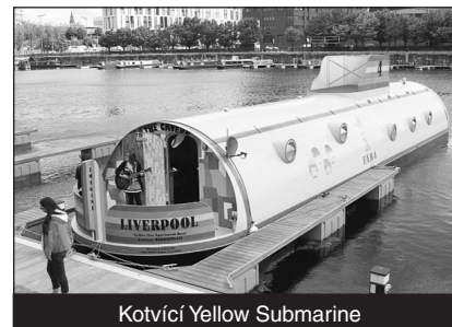
Kotvíci Yellow Submarine

Jeden liverpolský podnikatel nabízí nevšední zážitek pro fanoušky místních Fab Four – ubytování v ponorce Yellow Submarine. 24 metrů dlouhá loď, upravená jako plovoucí hotel, je vybarvena stejně jako originální plavidlo ve stejnojmenném filmu Beatles z roku 1969.