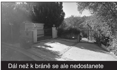
Dál než k bráně se ale nedostanete

2850 Benedict Canyon Drive v Beverly Hills byla losangeleskou adresou, která poskytla azyl a chvíle soukromí Beatles při jejich americkém turné v roce 1965. Čtyři ložnice, šest koupelen, dva bary, vinný sklep, pět krbů a šest garáží dala Broukům k dispozici tehdejší majitelka, herečka Zsa Zsa Gabor. Vila, postavená v roce 1949 ve španělském stylu, je nyní nabízena za 3,1 milionů dolarů. Podle realitního zprostředkovatele se na vybavení sídla od té doby mnoho nezměnilo.