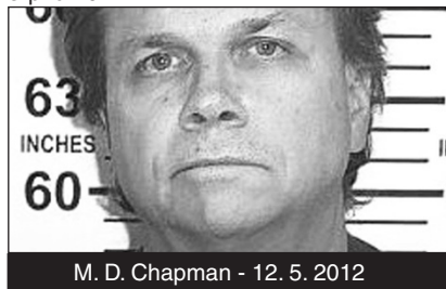
M. D. Chapman - 12. 5. 2012

Mark David Chapman, vrah Johna Lennona, letos v srpnu již posedmé požádal o podmíněčné propuštění – a opět s negativním výsledkem. Dnes sedmapadesátiletý Chapman může své štěstí zkusit znovu v srpnu 2014.