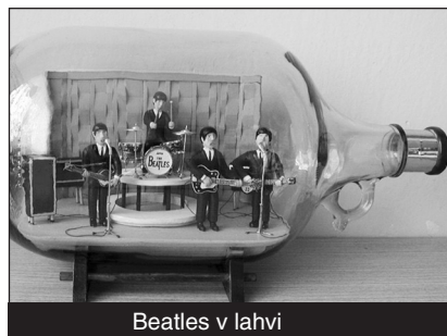
Beatles v lahvi

Již 21 let vyrábí Emanuel Hoda ze Strakonice různé modely v lahvi. A má jich již na svém kontě přes 800. Asi nejpracnější dílo, na které je modelář zároveň nejvyšší, je model skupiny Beatles při koncertě. „To byla skupina našeho mládí, proto jsem se ji rozhodl takto zvěčnit. Bylo to nesmírně pracné. Trvalo to téměř rok a půl, což je vůbec nejdéle ze všech mých prací.“ A ještě pár upřesňujících informací: Brouci jsou umístěni v pětilitrové lahvi od italského vína – průměr lahve 180 mm, výška 340 mm, vnitřní průměr hrdla 24 mm. A co dalo největce práce? Hlavičky a obličejky postavíček, aby odpovídaly pokud možno realitě, dále sestava bubnů. Pro zajímavost – činely mají velikost padesátníku, kytary jsou přibližně velikosti kostiček cukru.