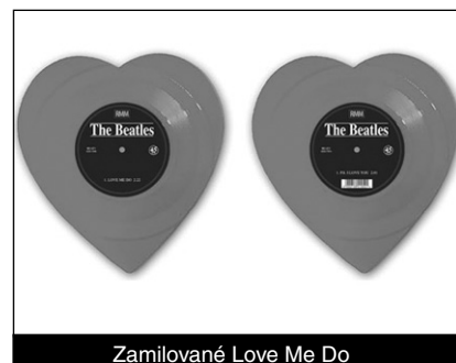
Zamilované Love Me Do

Firma Mischiev Musicco vydala unikátní verzi singlu Love Me Do / P. S. I Love You. Stalo se tak 26. července 2013 a dvanáctipalcový červený vinyl měl tvar srdce.