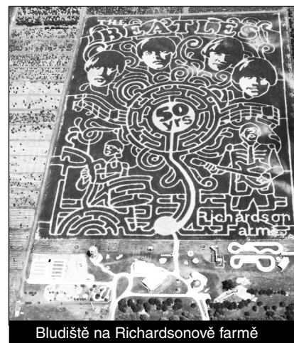
Bludiště na Richardsonově farmě

Zaměstnanci Richardsonovy dobrodružné farmy ve Spring Grove, Illinois, vytvořili na svých pozemcích u příležitosti 50. výročí vydání první dlouhohrající desky Beatles – Please Please Me obilné bludiště. Na 28 akrech vymodelovali labyrint cest v délce 11 mil (asi 18 km). Šéf firmy to komentoval: „Je ohromné vidět spojení zemědělství s tímto druhem zábavy.“