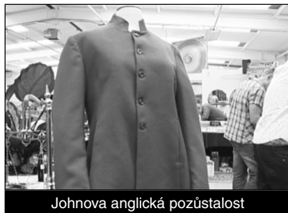
Johnova anglická pozůstalost