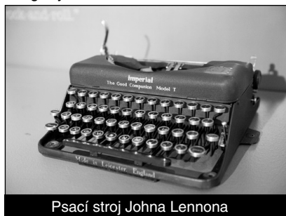
Psací stroj Johna Lennona

Galerie northeasternské univerzity v Bostonu uspořádala výstavu psacích strojů slavných spisovatelů a umělců, jako například Ray Bradbury, John Lennon či Ernest Hemingway.