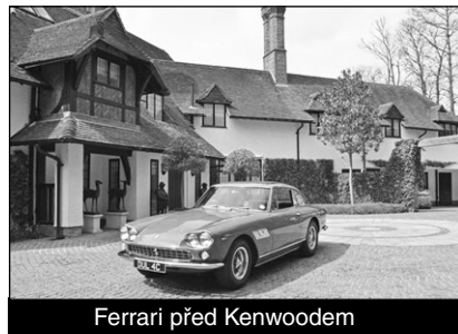
Ferrari před Kenwoodem

12. července bylo v dražbě prodáno Lennonovo Ferrari 330 GT Z ROKU 1965. Cena se nakonec zastavila na částce 360.000 liber. Lennon ho koupil měsíc po nahrání písně Ticket To Ride za 6.500 liber. Automobil byl zrestaurován a vybaven původní registrační značkou DUL 4C.