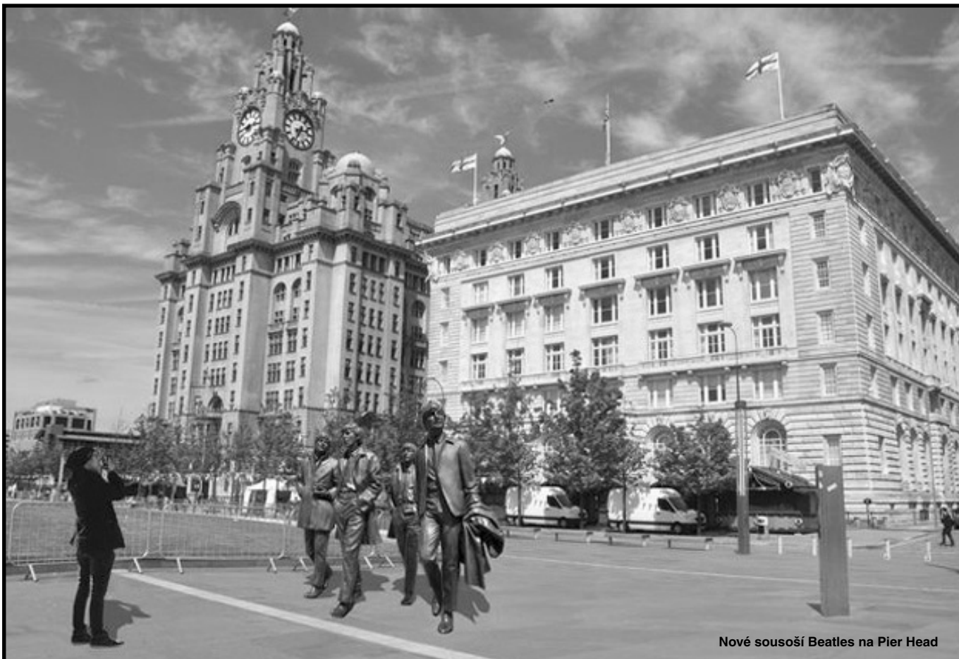
Nové sousoší Beatles na Pier Head