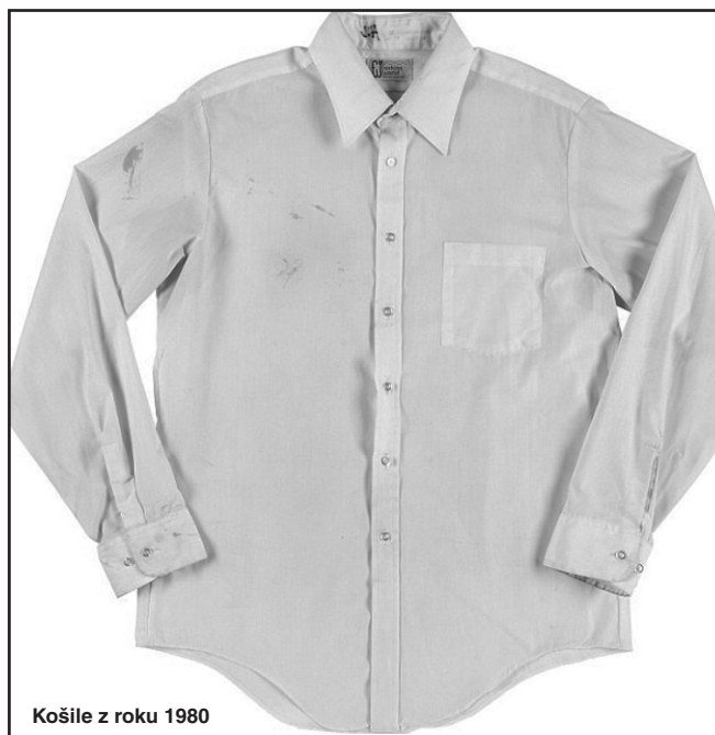
Košile z roku 1980