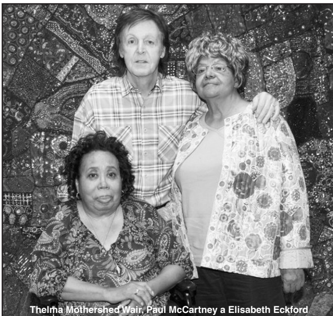
Thelma Mothershed Wair, Paul McCartney a Elisabeth Eckford

Paul McCartney se během koncertního zastavení v Little Rocku setkal se dvěma ženami, které ho inspirovali k napsání písně Blackbird. V roce 1954 byly mezi devíti černými studenty, kteří se pokusili nastoupit na „bělošskou“ střední školu ve městě Little Rock (Arkansas). Guvernér státu Arkansas povolal národní gardu, aby jim zabránila ve vstupu do budovy. Prezident Eisenhower na incident reagoval vysláním tisíce výsadkářů, kteří měli ochránit devět černých studentů a kteří zůstali v Little Rocku po celý školní rok. Brzy po těchto událostech byla rasová segregace na jihu oficiálně zrušena. McCartney k tomu dodal: „Chtěli jsme vědět, o co šlo, a měli jsme pochopení pro lidi procházející těmito útrapami. A to mě nutilo napsat tuto píseň.“