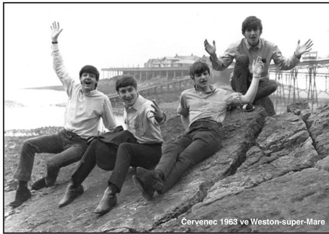
Červenec 1963 ve Weston-super-Mare

Na místě, kde Beatles pózovali během koncertní návštěvy anglického města Weston-super-Mare v červenci 1963 je nyní umístěna pamětní deska. Tím místem je skála u Birnbeck Pier.