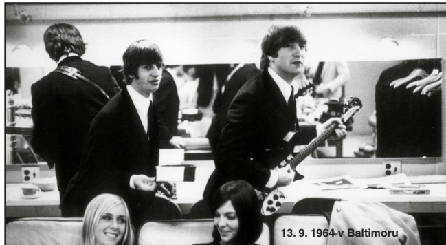
13. 9. 1964 v Baltimoru