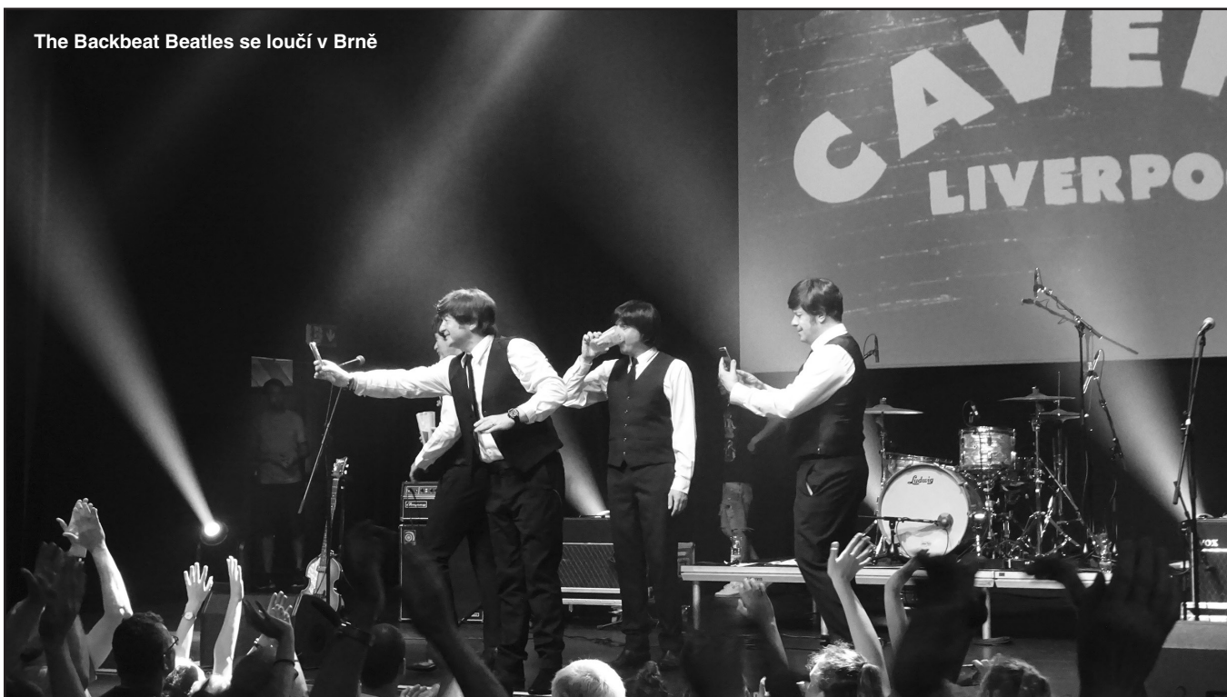
The Backbeat Beatles se loučí v Brně